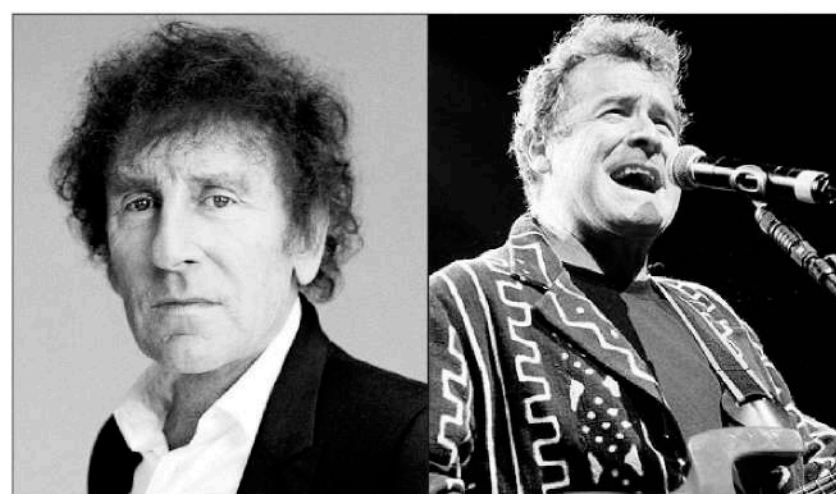
Le programme du festival taignon sera résolument «Paléo». Souchon, tout comme Johnny Clegg, se produiront également sur la plaine de l'Asse.

Outre ces têtes d'affiche, le festival (qui fait aussi office de tremplin décou-