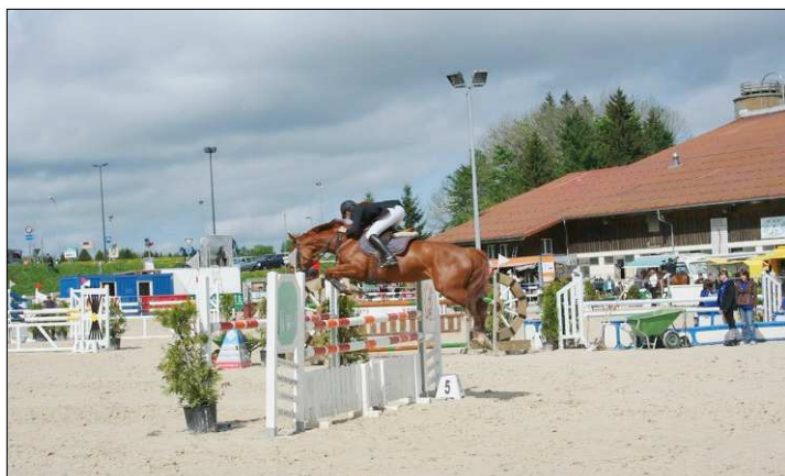
A L'ÉPREUVE Le concours se déroulera jusqu'à dimanche et se poursuivra le week-end prochain.

La journée du dimanche sera particulièrement importante.