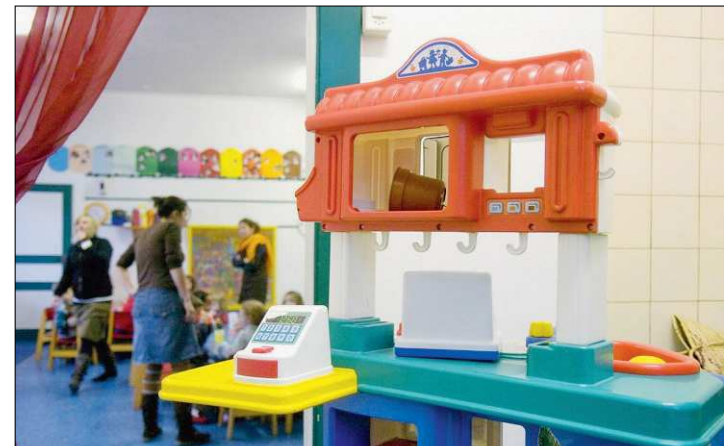
ACCUEIL Un crédit d'étude a été accepté.