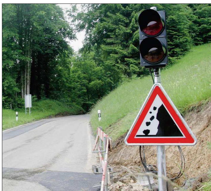
SÉCURITÉ Des feux de signalisation avertiront les usagers en cas d'éventuelles chutes de pierres. (BIST)

L'ensemble des travaux routiers et ferroviaires auront coûté près de deux millions de francs. /mmo